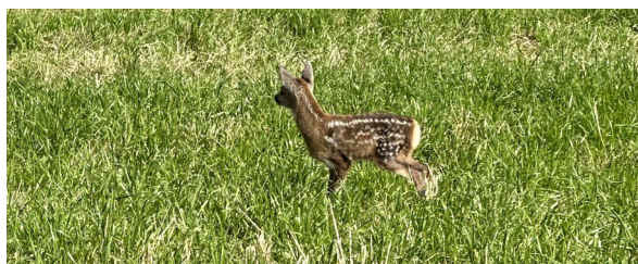
Wieder in Freiheit!