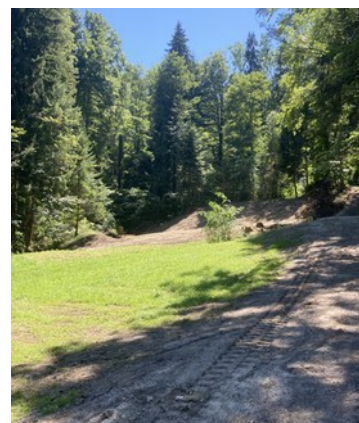
Nach Abschluss der Arbeiten