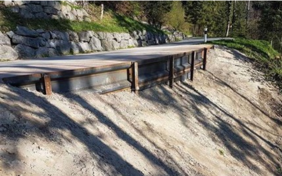
Beispiel eines «Ribbert-Verbaus»

Die Bauarbeiten erfolgen vom 29. August bis 2. Oktober 2022. Zeitweise muss der Verkehr einspurig mittels einer Lichtsignalanlage geleitet werden.