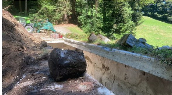
Zeigergraben vor dem Abbruch