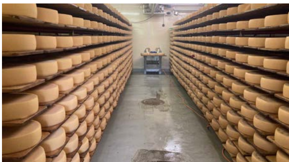
Käselager im Vorderhof