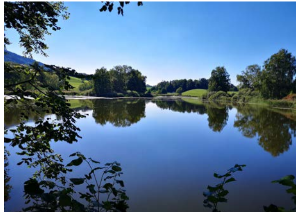
Um den Schlossweiher gelten GAÖL-Verträge

In diesem Sinn hat der Gemeinderat einen weiteren Energie-Förderbeitrag für eine Photovoltaikanlage von Urs und Susanna Imhof, Schiben 2, zugesichert.