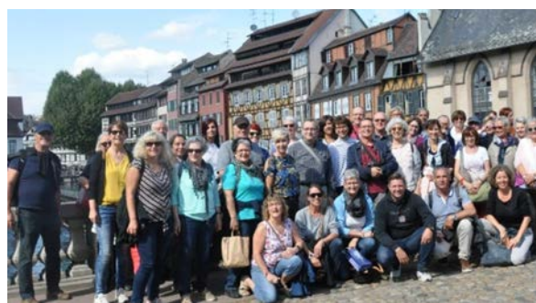
Chor "the waves"