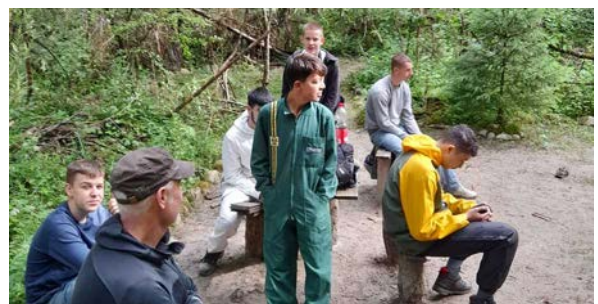
Schulklasse in der Pause