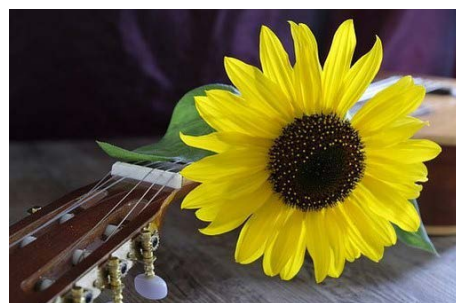
Sommer Musik

Dies ist der erste Teil einer vierteiligen Konzertreihe durch die Jahreszeiten.