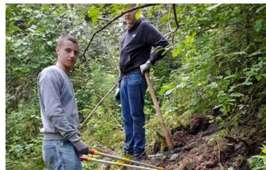
Jungs beim Ausreissen