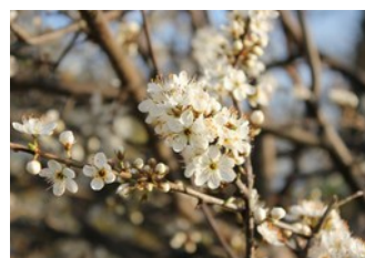
Weisse Blütenpracht des Schwarzdorns.

Aufgewertete Waldränder sind ökologisch wertvoll und schaffen eine attraktive Landschaft zu jeder Jahreszeit. Dank dem vielen Licht kann sich eine reichblühende, attraktive Kraut- und Strauchschicht entwickeln. Waldränder sind ein sicheres Versteck für Vögel, ein Paradies für Bienen oder Schmetterlinge und vermitteln Frühlingsgefühle für uns Menschen. Jeder Baum und jeder Strauch blüht und fruchtet zu verschiedenen Zeiten und in anderen Farben. Der Schwarzdorn blüht beispielsweise schneeweiss bereits vor dem Austrieb der Blätter. Ebenfalls landschaftsprägend ist die unterschiedliche Herbstfärbung. Was wäre ein Herbst ohne das goldene Leuchten von Birken, Lärchen, Espen oder Haselnuss am Waldrand?