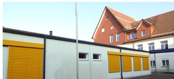
Beim Pavillon musste die Entwässerung repariert werden.

Trotz coronabedingten Mehrkosten ist der Gemeindeanteil an den Kosten unseres Postautokurses tiefer ausgefallen, weil mehr Bundesabgeltungen geflossen sind als vom Kanton erwartet. Der geplante Fensterersatz auf der Südseite der Seniorenwohnungen konnte im Jahr 2020 wegen Lieferverzögerungen noch nicht vorgenommen werden. Er erfolgt im Frühling 2021. Hingegen mussten unvorhersehbare Mehraufwände beim Unterhalt der Schulliegenschaften (Entwässerung Pavillon, Notbeleuchtung Mehrzweckgebäude, Sicherheitsgeländer Südseite, Stützmauer Umgebung Dorfstube) bezahlt werden. Der Aufwand für Pflegefinanzierungen, Sozialhilfe und Heimplatzierungen fiel ebenfalls höher aus als budgetiert. Durch den Lockdown ist das Geschäft mit den Tageskarten Gemeinde der SBB stark eingebrochen, was zu einem wesentlich tieferen Ertrag geführt hat. Der Aufwandüberschuss von Fr. 88'166.57 wird gedeckt durch einen Bezug aus dem Bilanzüberschuss im Eigenkapital, dessen Bestand sich auf Fr. 3'353'835.14 reduziert.