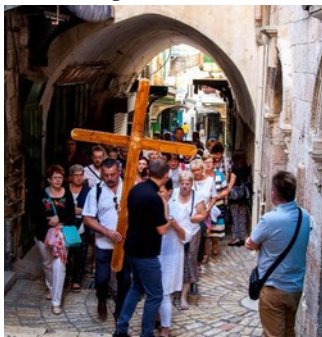
Via Dolorosa Jerusalem