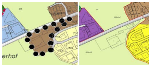
Zonenplan im Mittlerhof: Links geplant, rechts bestehend

Die grosse Scheune und das Betriebsleiterwohnhaus im Westen des Mittlerhofs sind aktuell über eine schmale steile Strasse als Fortsetzung der Gemeindestrasse 3. Klasse Emsweg erschlossen. Im neuen Raumplanungsrecht des Bundes und vor allem des Kantons sind entscheidende Voraussetzungen für neue Überbauungen nebst der Innenentwicklung die Erhältlichkeit bei der Einzonung. Für die genannte Liegenschaft ist beides erfüllt. Der Gemeinderat hat eine Überbauungsstudie erarbeiten lassen, welche aufzeigt, dass das Gelände mit 4 – 5 Gebäuden mit 19 bis 28 zeitgemässen Wohnungen mit Seesicht überbaut werden kann. Dabei kann gewährleistet werden, dass die Seesicht bestehender Häuser an der Fellenbergstrasse nicht eingeschränkt wird.