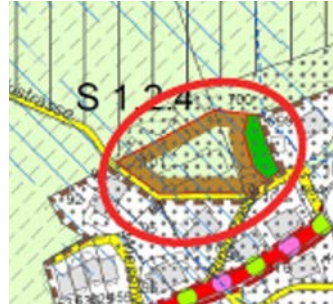
Erweiterung Siedlungsgebiet im Norden des Mittlerhofs für Wohnnutzung

Durch den plötzlichen Tod eines Landwirtes letzten Sommer sind zwei von diesem bewirtschaftete Landwirtschaftsbetriebe frei geworden, ohne dass diese als eigener Betrieb weitergeführt werden. Da beide Betriebsgebäude im Siedlungsgebiet oder gleich am Rand im Mittlerhof liegen, macht eine Überbauung mit Wohnbauten anstelle der Scheunen Sinn. Dies entspricht im übrigen der Politik des Gemeinderates, welche bereits im Richtplan zum Ausdruck kommt, wo zwei bestehende Landwirtschaftsbetriebe bzw. das Umland der heutigen Betriebsgebäude im Vorderhof und Hinterhof ins Siedlungsgebiet eingeteilt wurden. Sie können im Fall einer Änderung der Betriebsstruktur einer Überbauung zugeführt werden. So beabsichtigt der Gemeinderat, die einen Betriebsgebäude im Norden des Mittlerhofs ebenfalls ins Siedlungsgebiet im Richtplan aufzunehmen. Auch hier wäre für eine spätere Einzonung eine Überbauungsstudie vorzu-