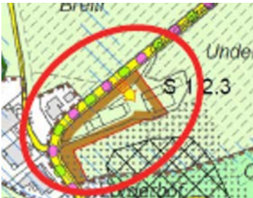
Erweiterung Siedlungsgebiet im Unterbach für Wohnnutzung hoher Dichte

ronabedingt in zwei Anläufen der Vernehmlassung unterstellt. Im sogenannten Mitwirkungsverfahren ist lediglich eine Eingabe eingegangen. Diese hat gewünscht, dass landwirtschaftliche Betriebsgebäude im Unterbach ins Siedlungsgebiet einbezogen werden. Die Planungskommission hat diese Erweiterung des Siedlungsgebietes bereits im Vorfeld diskutiert. Der Gemeinderat hat dem Ansinnen zugestimmt, weil damit ein ortsbaulich guter Abschluss des Siedlungsgebietes geschaffen würde und der Dorfeingang von Goldach her mit Wohnbauten gestaltet werden kann. Eine Einzonung müsste später mit einem Teilzonenplan erfolgen, wofür vorgängig eine Überbauungsstudie mit Angaben über die Erschliessung und Stellung der Bauten am Dorfeingang erforderlich sein wird.